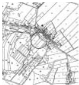
Lageplan 1: 5000

Der Geltungsbereich der Ergänzungssatzung umfasst eine Teilfläche der Grundstücke der FlNr. 949/1, 949, 948, 944, 943 und 942 der Gemarkung Wolfstein. Anlass und Zielsetzung der Planung ist eine Unterstützung und Erhaltung stabiler Bewohnerstrukturen innerhalb der Dorfgemeinschaft, sowie die Förderung von Eigentumsbildung, die langfristig einer Abwanderung aus den Dorfgebieten entgegenwirken soll. Durch die Nachverdichtung der Bebauung am südlichen Ortsrand von Winkelbrunn soll die Lücke im Dorf geschlossen und Parzellen für eine Wohnbebauung geschaffen werden.