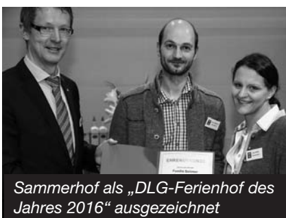
Sammerhof als „DLG-Ferienhof des Jahres 2016“ ausgezeichnet

Der Bildungsträger ebiz, Passau, ist Kooperationspartner der Offenen Ganztagschule an der Mittelschule Freyung und der Mittagsbetreuung an der Grundschule am Schloss Wolfstein . Zur Verstärkung unseres Teams suchen wir ab 01.09.2017