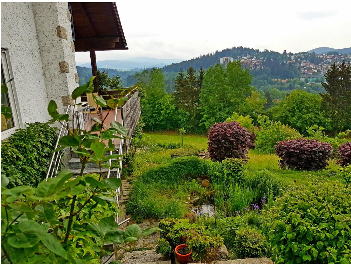
Außenansicht, Blick Richtung Stadt