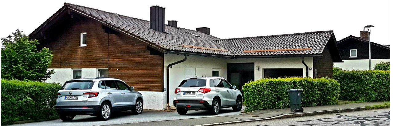
Außenansicht, Eingangsbereich, Garage