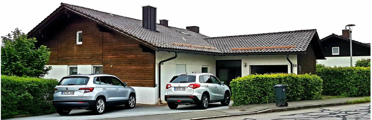
Außenansicht, Eingangsbereich, Garage